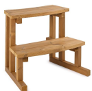
Stepin Treppe, aus Thermoholz